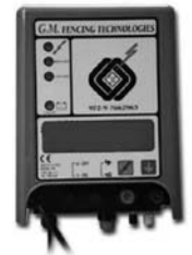
Рис. 3. Лицевая панель контроллера IH1L1E

Технология GM, используемая в контроллере, дает широкие возможности по адаптации системы к изменяющимся условиям ее работы. Порог срабатывания по генерации высоковольтных импульсов адаптивно меняется в зависимости от уровня влажности и других факторов с целью сохранения наивысшего уровня сигнала. Система может быть предварительно запрограммирована в соответствии со специфическими условиями работы. Контроллеры устройства охран-